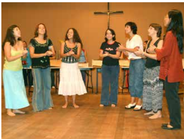
I Curso Internacional Orff-Schulwerk em São Paulo/ SP - 2005