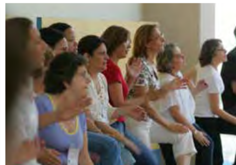
III Curso Internacional Orff-Schulwerk em São Paulo/SP - 2007

“A ABRAORFF é uma associação que inspira e transforma os seus associados constantemente. Tudo o que oferece sempre valida a ideia de música e movimento na educação. É sensível no seu olhar, atenta na sua escuta e, principalmente, reflexiva! A associação reafirma a ideia de que a educação não pode estagnar e que temos uma vida inteira de aprendizado. A cada encontro mensal, a cada Simpósio ou Seminário e a cada Curso Internacional realizado, a ABRAORFF me faz acreditar que no ensino da música, a vivência e a prática são mais importantes do que a teoria, que refletir sobre a prática é fundamental, que o nosso corpo é um elemento gerador de som e ritmo e que a criação e a improvisação são essenciais! Obrigada ABRAORFF!”