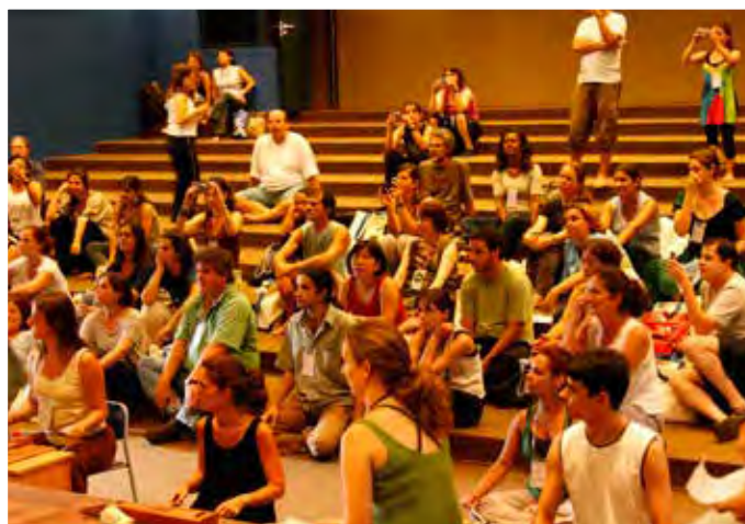
IV Curso Internacional Orff -Schulwerk em São Paulo/SP - 2009