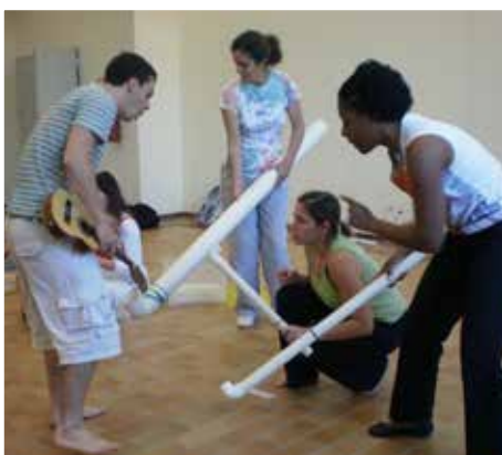
Oficina “Mirabolâncias pelo Mundo” em São Paulo/SP - 2011