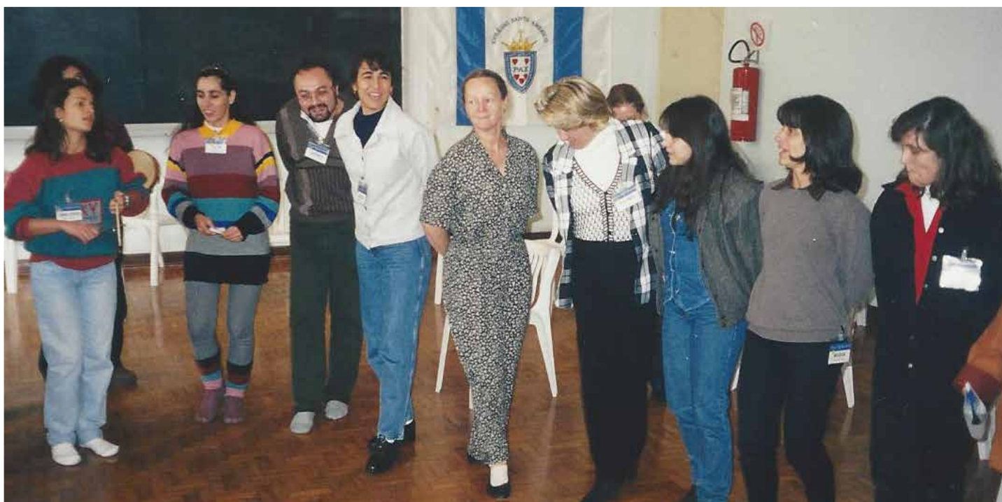
I Curso de Férias Orff-Schulwerk em São Paulo/SP – 1998

Para que esse processo seja realmente valioso, o papel e a formação dos professores são fundamentais. Por isso, nessa edição comemoramos com muito orgulho o aniversário de 10 anos da nossa associação, que tem contribuído para o enriquecimento musical e a troca de experiências significativas em cursos, encontros, debates, palestras e workshops. A seguir, confira os depoimentos de associados, amigos, colaboradores, professores, músicos e educadores sobre sua trajetória na ABRAORFF e sobre o que construímos nesses anos.