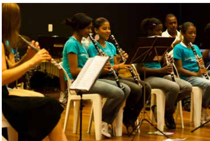
Banda Sinfônica Eszterháza - I Simpósio Internacional Orff-Schulwerk em São Paulo/ SP - 2011

“Fazer parte da ABRAORFF mudou tanto a minha maneira de ensinar música como a minha vida. Logo no primeiro curso internacional, fiquei encantada e já consegui organizar um musical com meus alunos. Coloquei em prática os vários ensinamentos que recebi, misturando canto, dança, instrumentos musicais e teatro, e as próprias crianças ajudaram a criar o musical, inclusive o cenário. Passei a vivenciar a música de uma forma integral, de corpo e de alma, e me tornei uma pessoa e professora mais completa e mais feliz. Participei por anos de vários encontros mensais, além de vários outros cursos nacionais e internacionais, encontrei pessoas maravilhosas e troquei experiências que me trouxeram um grande enriquecimento. Sou eternamente grata a todos que fizeram parte dessa trajetória!”