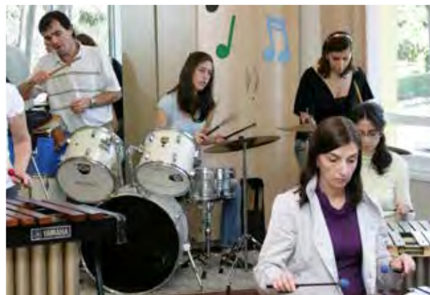
The Jazz Course em São Paulo - 2010

“Muitas vezes, em nosso país, associações ligadas a correntes específicas do pensamento sobre arte e educação permanecem fechadas em si, isoladas umas das outras. Esse nunca foi o caso da ABRAORFF, que agora celebra os seus 10 anos. Nascida dos históricos cursos realizados de forma pioneira pelo Colégio Santo Américo, a Associação Orff Brasil - em consonância com a postura inclusiva, aberta e interdisciplinar da pedagogia Orff-Schulwerk - tem sido uma referência na educação musical brasileira. A ABRAORFF não tem apenas realizado periodicamente cursos internacionais de formação Orff-Schulwerk, mas trabalhado também de uma forma ampla com os mais diversos aspectos do ensino musical em seus grupos de estudo e na organização de oficinas com eminentes músicos e professores convidados. Vida longa para a ABRAORFF!”