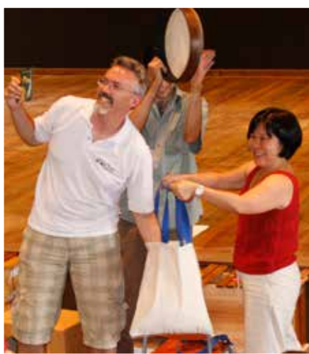
IV Curso Internacional Orff-Schulwerk em São Paulo/SP - 2009

“A ABRAORFF foi um presente que surgiu na minha vida. Até hoje compartilho este presente que veio cheio de idéias, através de processos criativos e de uma dinâmica do movimento para a música e da música para o movimento. Sempre que posso utilizo em aulas a presença de pessoas para explorar percepções corporais diversas e para construir imagens presentes do cotidiano e do que cada uma delas carrega em suas vidas. Isso ajuda a levar o conhecimento e o reconhecimento por meio das danças, além de obter outros resultados positivos de forma super sustentável, sem nenhum desperdício de aproveitamento. E o melhor de tudo: tenho utilizado o método para uma faixa etária de 5 a 87 anos, pois tenho ido a diversos lugares com necessidades diversas. Aqui deixo o meu agradecimento pelo presente de Natal eterno. Vocês, cuidadores da ABRAORFF, tem nos olhado com muito carinho e eu espero que também possam receber este presente incondicional de volta.”