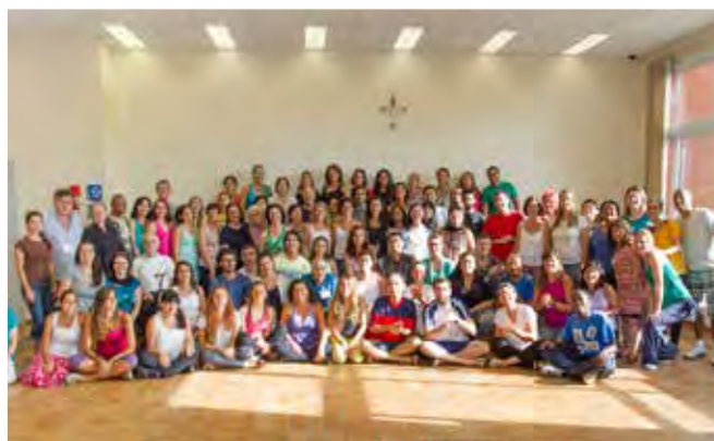
VII Curso Internacional Orff-Schulwerk em São Paulo/SP - 2014