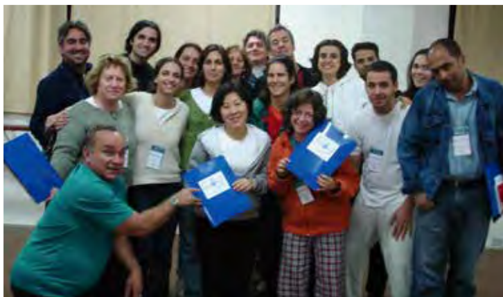
Oficinas de Parlandas e Melodias pentatônicas em São Paulo - 2006