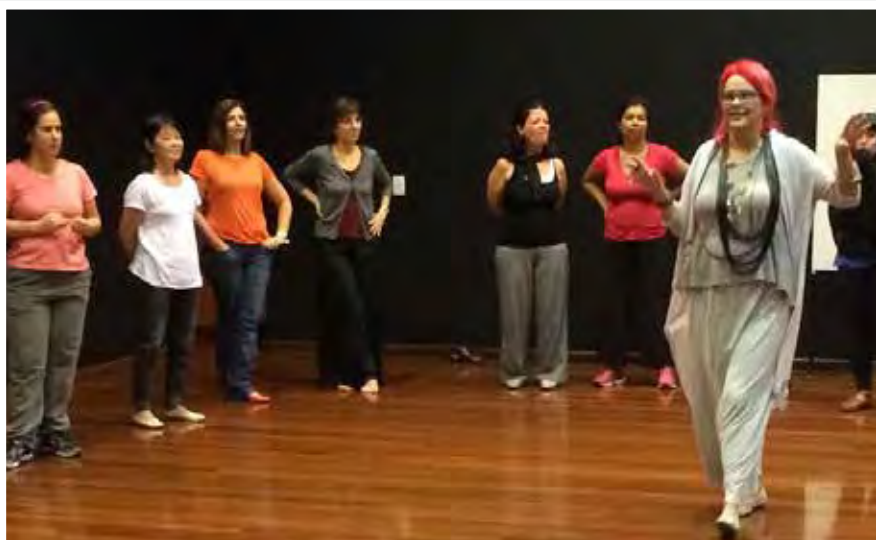
Oficina: "MÚSICAS INDÍGENAS – Pesquisa e prática" em São Paulo - 2014