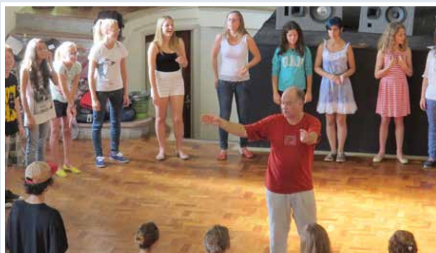
VII Curso Internacional Orff-Schulwerk em Caxias do Sul/RS - 2014