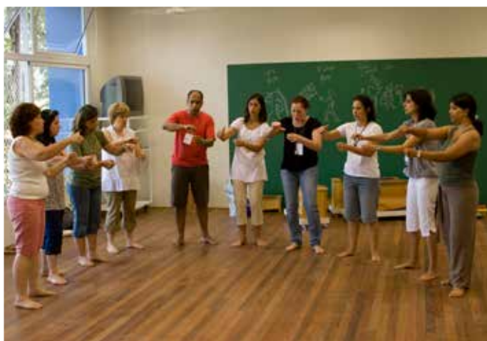
IV Curso Internacional Orff -Schulwerk em São Paulo/SP - 2009

Educadora musical e musicista – Vinhedo -SP