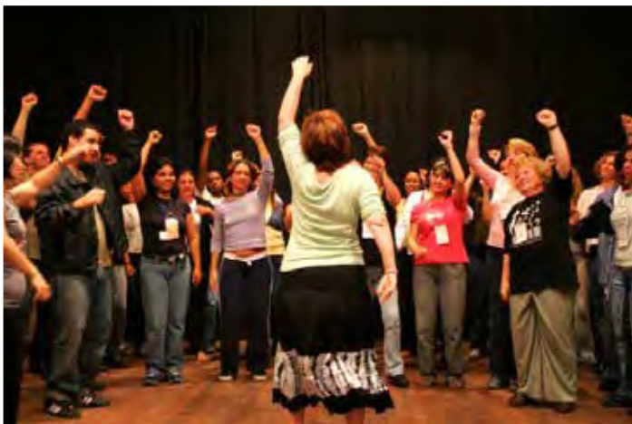
III Curso Internacional Orff-Schulwerk em São Paulo/SP - 2007

“No decorrer desses 10 anos a ABRAORFF tornou-se um espaço de (auto) formação profissional e pessoal, campo de experiências e conquistas! Mais do que um espaço de cursos e encontros, temos nesse grupo amigos com quem podemos compartilhar experiências no campo da Educação Musical.”