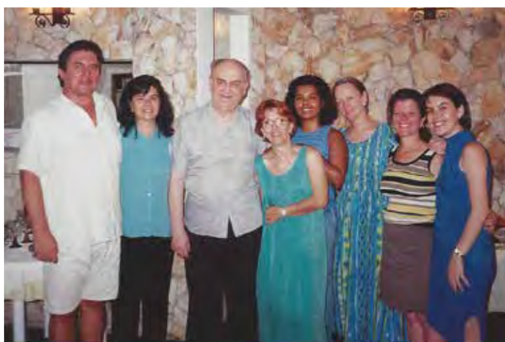
II Curso de Férias Orff-Schulwerk em São Paulo/SP - 2001

"Com um olhar multidisciplinar, a ABRAORFF é um excelente e essencial pólo de enriquecimento do arte-educador. A música, a dança, as artes visuais, a contação de histórias, a construção de instrumentos e tantas outras atividades abordadas em cursos, oficinas e grupos de estudo extrapolam as fronteiras de suas especificidades e simplificam intrincados diálogos. A experimentação e a vivência no corpo, na voz e no instrumento, tornam a assimilação naturalmente fácil e possível pelo universo da criança."