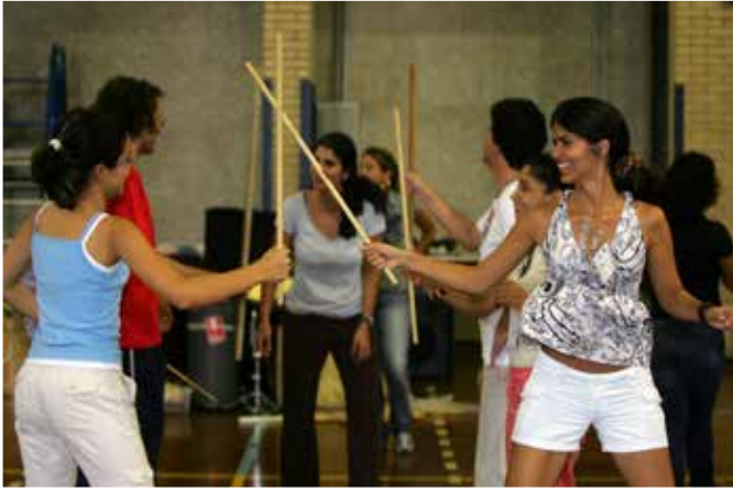
III Curso Internacional Orff-Schulwerk em São Paulo/SP - 2007