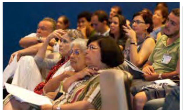
I Simpósio Internacional Orff-Schulwerk em São Paulo/ SP - 2011