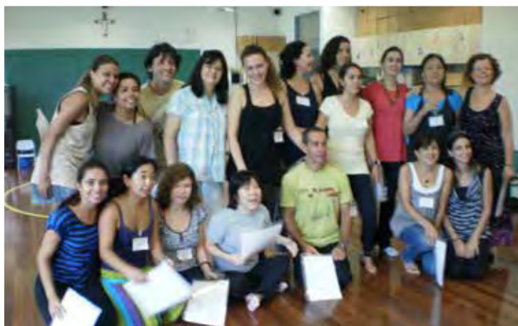
Oficina “Dança Educativa/Criativa em sala de aula” em São Paulo/SP - 2012

Arte Educadora e Coordenadora de Música da EMIA (Escola Municipal de Iniciação Artística) SP