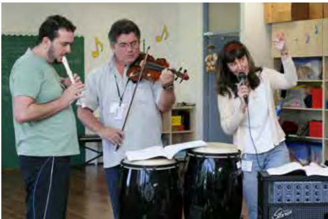
The Jazz Course em São Paulo - 2010

“Dez anos promovendo cursos internacionais, workshops, grupos de estudo, oficinas, simpósios, publicações. Dez anos trazendo professores especialistas em Orff- Schulwerk, que nos brindam com atividades de improvisação, música, movimento, integração de linguagens, além de uma pitada de cultura brasileira. É um grande privilégio poder vivenciar tantos momentos de prática e reflexão sobre os princípios e práticas de Carl Orff, através de uma convivência harmônica, tanto entre as pessoas, quanto com a música. Vida longa à ABRAORFF e obrigada a todos que, através de sua colaboração e empenho, fazem parte desta grande e importante associação. Parabéns ABRAORFF!”