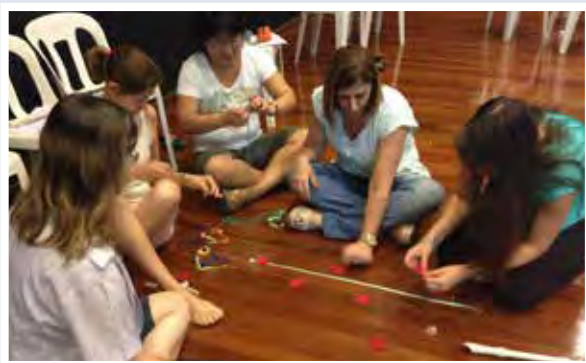
Oficina: "Da exploração à improvisação: práticas criativas com a flauta doce" em São Paulo - 2014

Tivemos também II Prêmio Orfferos do Ano, contemplando associados e participantes do curso. Para comemorar os 10 anos de ABRAORFF, apresentamos um slideshow e prestamos uma homenagem às pessoas que contribuíram direta e indiretamente neste percurso de nossa querida associação. Para finalizar em grande estilo, tivemos um churrasco que contou com amigos, professores e associados, que puderam confraternizar e comemorar o 10º aniversário da ABRAORFF.