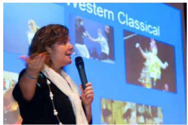
I Simpósio Internacional Orff-Schulwerk em São Paulo/ SP - 2011

Professora da Licenciatura em Educação Musical da UFSCar e Coordenadora e Professora no Conservatório de Tatuí.