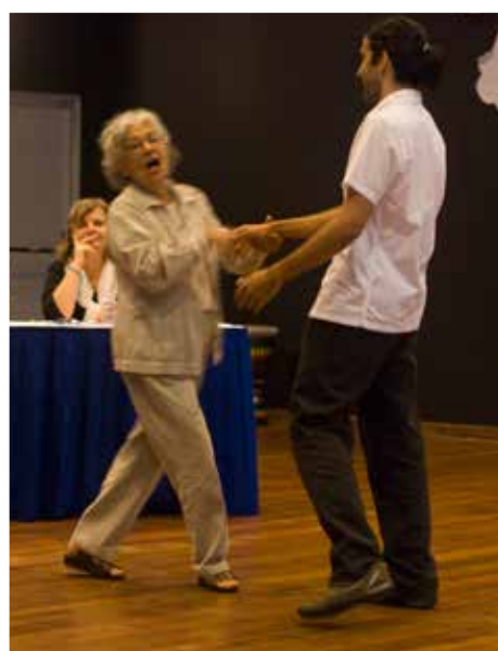
I Simpósio Internacional Orff Schulwerk em São Paulo/SP - 2011

“A Associação ABRAORFF completa 10 anos e está de parabéns! Levar adiante o desejo de Carl Orff em prol de uma educação musical viva e plena de significado, especialmente para as crianças é, sem dúvida, uma empreitada digna de muito respeito e admiração! Em contínuo e dinâmico movimento, a ABRAORFF realiza cursos, oficinas e encontros de efetiva qualidade, ministrados por profissionais competentes e dedicados, do Brasil e do exterior. Valorizando aspectos diversos e significativos da escuta à produção, do corpo aos materiais, da interpretação à criação, do Brasil ao mundo -, a Associação tem contribuído com o enriquecimento e o amadurecimento do trabalho com a música na educação em nosso país e tornou-se uma importante referência de formação pedagógico-musical. Vida muito longa e sempre muito viva é o que eu desejo à ABRAORFF!”