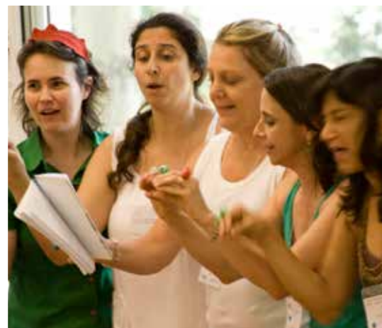
IV Curso Internacional Orff -Schulwerk em São Paulo/SP - 2009